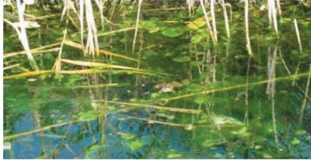
2. Τεχνικά Στοιχεία (εις διπλούν):

i) Βεβαίωση έναρξης εργασιών από την αντίστοιχη Δημόσια Οικονομική Υπηρεσία (Δ.Ο.Υ.) και τις μεταβολές της, αν πρόκειται για Φυσικά Πρόσωπα ή Ατομική Επιχείρηση. Αν πρόκειται για Νομικά Πρόσωπα Πιστοποιητικό αρμόδιας Υπηρεσίας Γ.Ε.Μ.Η.